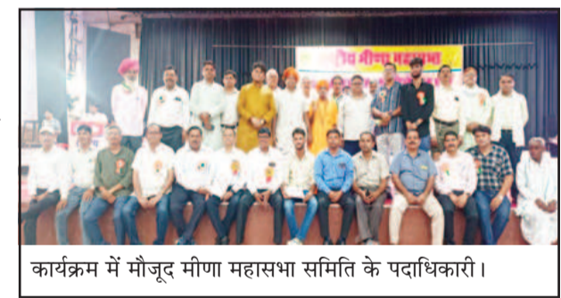
कार्यक्रम में मौजूद मीणा महासभा समिति के पदाधिकारी।