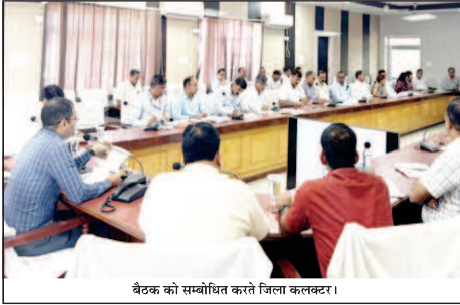
बैठक को सम्बोधित करते जिला कलक्टर।

जिला कलक्टर ने कहा कि सभी विभाग विभागीय योजनाओं की प्रगति के लिए निरंतर मॉनिटरिंग करें, सरकार की बजट घोषणाओं का समय पर क्रियान्वयन सुनिश्चित करें। उन्होंने कहा कि बरसात के बाद सड़क मरम्मत, पानी निकासी एवं आपदा राहत के कार्यों में सम्बंधित अधिकारी त्वरित निर्णय लेकर कार्य पूरा करें। उन्होंने शहरी क्षेत्र में जलभराव वाले क्षेत्रों को चिन्हित कर पानी निकासी सुनिश्चित करते हुए साफ-सफाई के साथ एंटीलार्वा गतिविधि भी करें। उन्होंने शहरी एवं ग्रामीण क्षेत्रों में सभी नगर निकायों, पंचायत समिति एवं ग्राम पंचायतों से समन्वय कर चिकित्सा विभाग को एंटीलार्वा गतिविधि करवाने, मच्छरों की रोकथाम के लिए वीटीआई दवा का छिड़काव करवाने के निर्देश दिए। उन्होंने कहा कि मलेरिया रोधी कार्यक्रम में सभी विभाग जिम्मेदारी से कार्य करते हुए