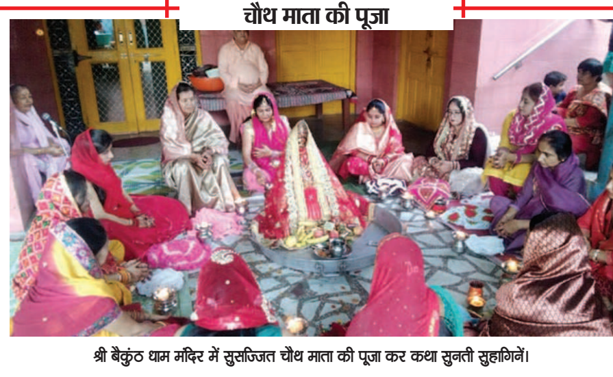
श्री बैकुंठ धाम मंदिर में सुसज्जित चौथ माता की पूजा कर कथा सुनती सुहागिणें।