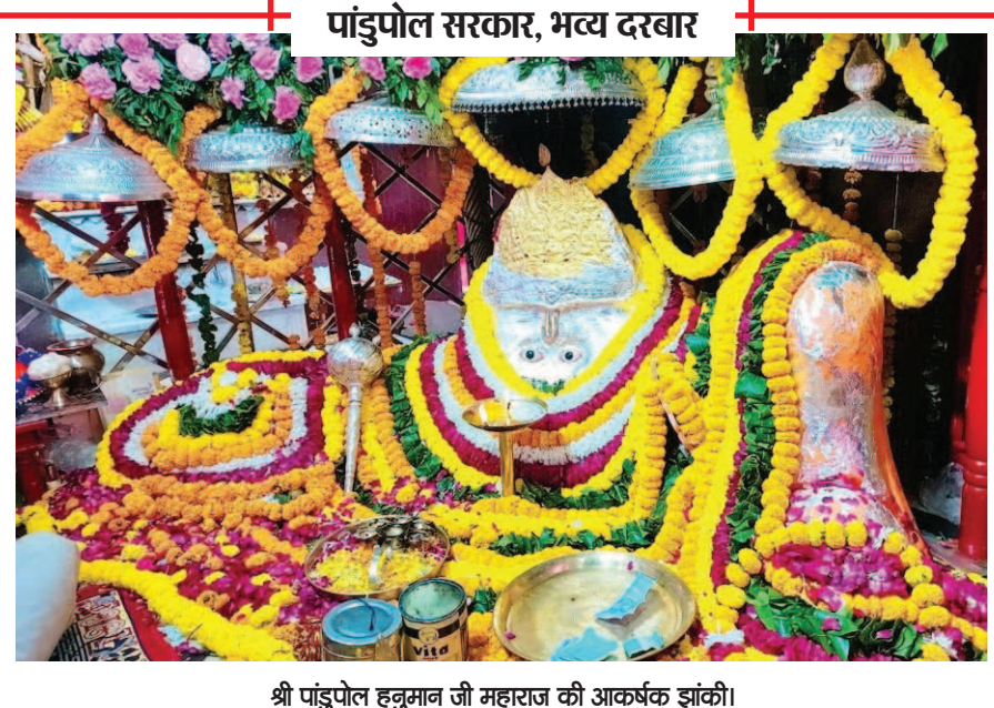
श्री पांडुपुल हनुमान जी महाराज की आकर्षक झांकी।