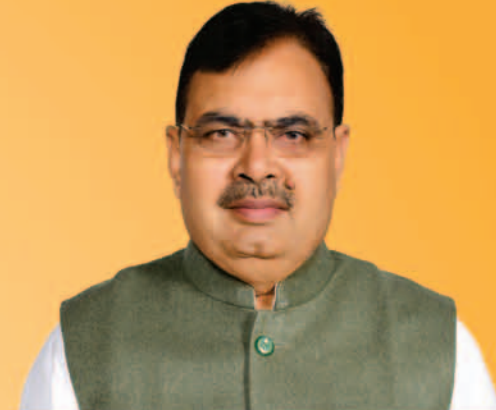
श्री भजनलाल शर्मा माननीय मुख्यमंत्री