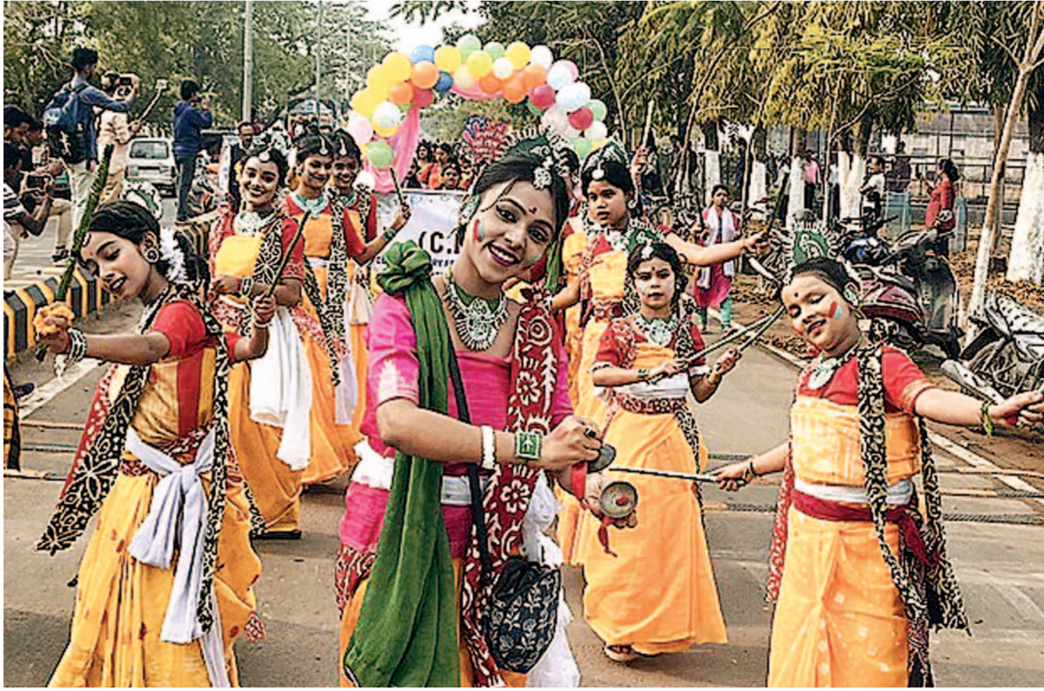
उत्तरी त्रिपुरा जिले के धर्मनगर इलाके में 'डोल' उत्सव जुलूस, जिसे 'डोलो जात्रा' भी कहा जाता है निकाला गया। इस दौरान बच्चे नृत्य करते हुए।