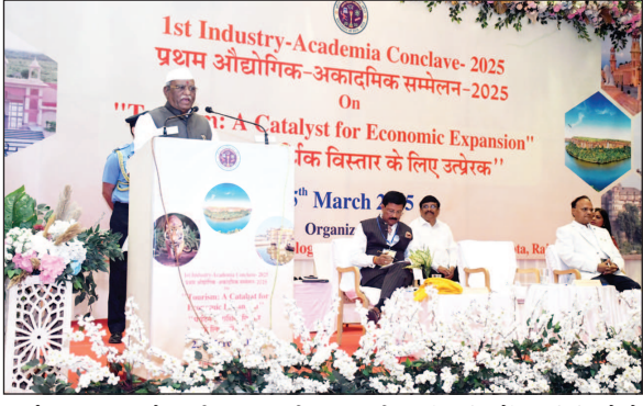
राजस्थान के पर्यटन स्थलों की अपार संभावनाएं- राज्यपाल ने राजस्थान के किताबें, हवेलियों, मंदिरों, वन्यजीव अभयारण्यों और पारिस्थितिकी तंत्र का उल्लेख करते हुए कहा कि राजस्थान देश और विदेश के पर्यटकों के लिए हमेशा आकर्षण का केन्द्र रहा है। उन्होंने कहा कि पर्यटन एक ऐसा उद्योग है जो अन्य छोटे व्यवसायों को भी प्रोत्साहित करता है, जिससे स्थानीय स्तर पर रोजगार के अवसरों में वृद्धि होती है।

उन्होंने कहा कि वर्तमान समय में पर्यटन और कौशल विकास साथ-साथ चलते हैं। यदि युवाओं को पर्यटन उद्योग से जोड़ते हुए उन्हें आवश्यक कौशल प्रदान किया जाए, तो इससे रोजगार के अवसरों में वृद्धि होगी। उन्होंने कोटा उद्योग, टूर गाइड, इको-टूरिज्म और सांस्कृतिक पर्यटन को बढ़ावा देने की आवश्यकता पर बल दिया, जिससे स्थानीय